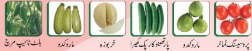
پروسیڈنگ ٹمائٹر ماروکوڈو پارتھینو کارپک کھیرا خربوزہ ماروکوڈو بلٹ ٹائپ مرچ

سہزیات کے نئے آنے والے بہترین ہائبرڈ بیج